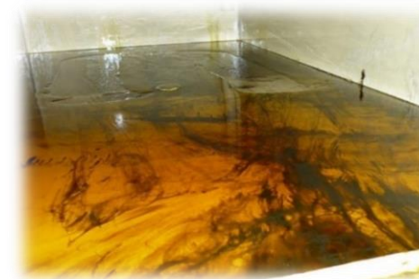
※油圧タンク内（黒靄がスラッジ）

長期間（約5年）オイル交換をせずに設備を使用すると、タンク内にはスラッジ（異物）が発生します。スラッジによりさまざまな設備トラブルが発生する為、定期的なオイル交換を推奨しております。また、オイル交換をせず、オイルの継ぎ足しのみはスラッジが蓄積する為危険です。まずは、分析をお勧めいたします。